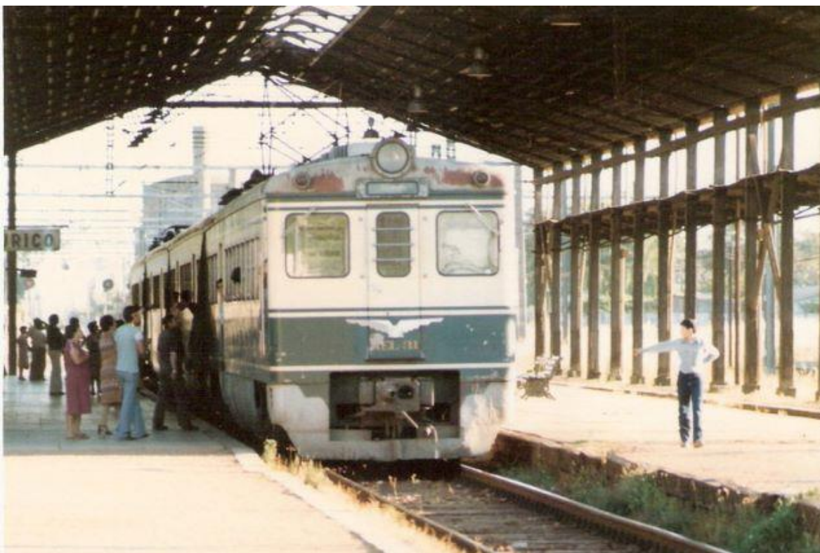
AEL 31 en Estación de Curicó durante la fase de abandono (sin fuente conocida)

En esta línea, el actual estado de deterioro de las vías y de algunos trenes, corresponde entonces al abandono de los ferrocarriles desde el año 78, con muy pocos y ocasionales intentos de proyectos de renovación.