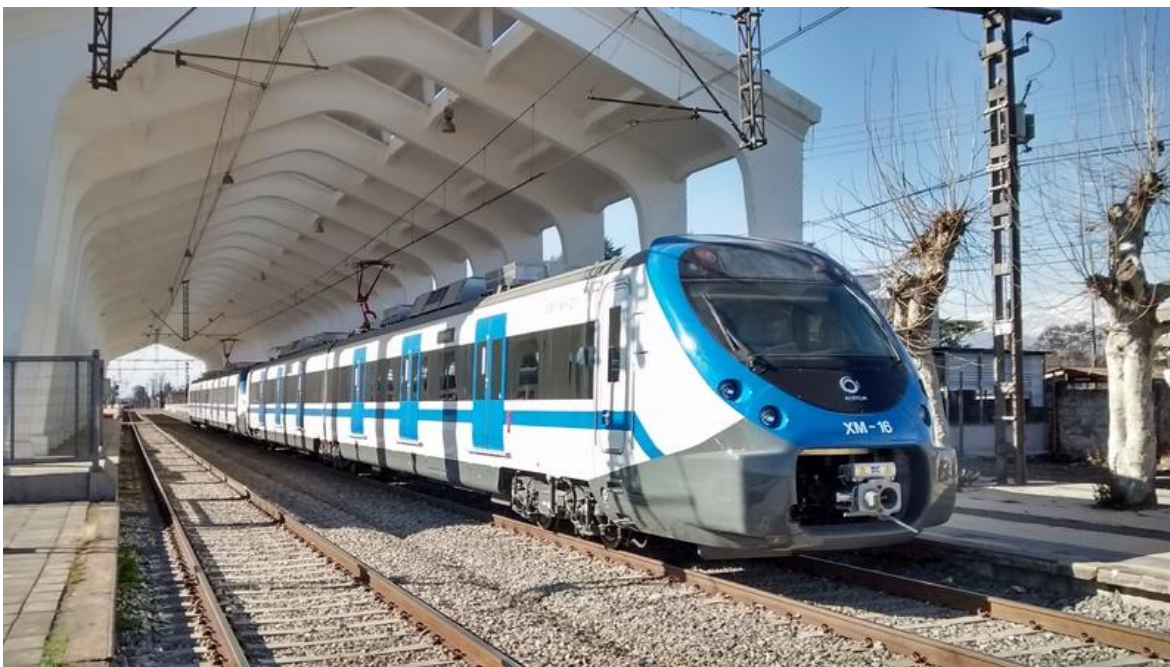
Rancagua express