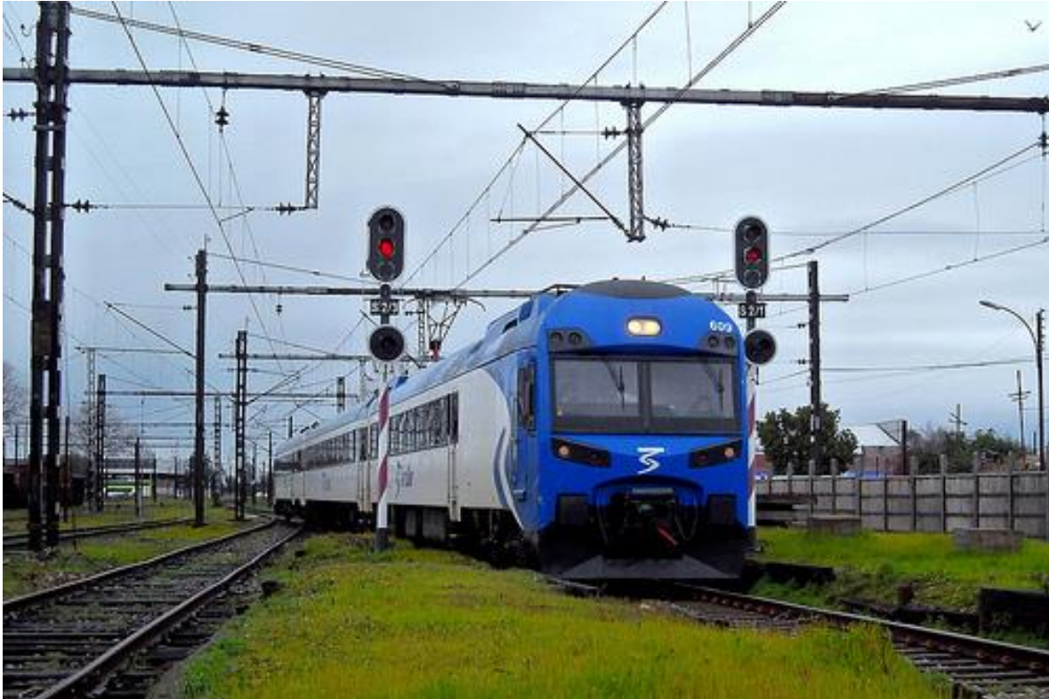
Terrasur en Estación Chillán

pareciera que va a ser requerido prontamente. Propongo mirar el gran cuadro y luego desagregar por fases y tiempos para hacerlo posible.