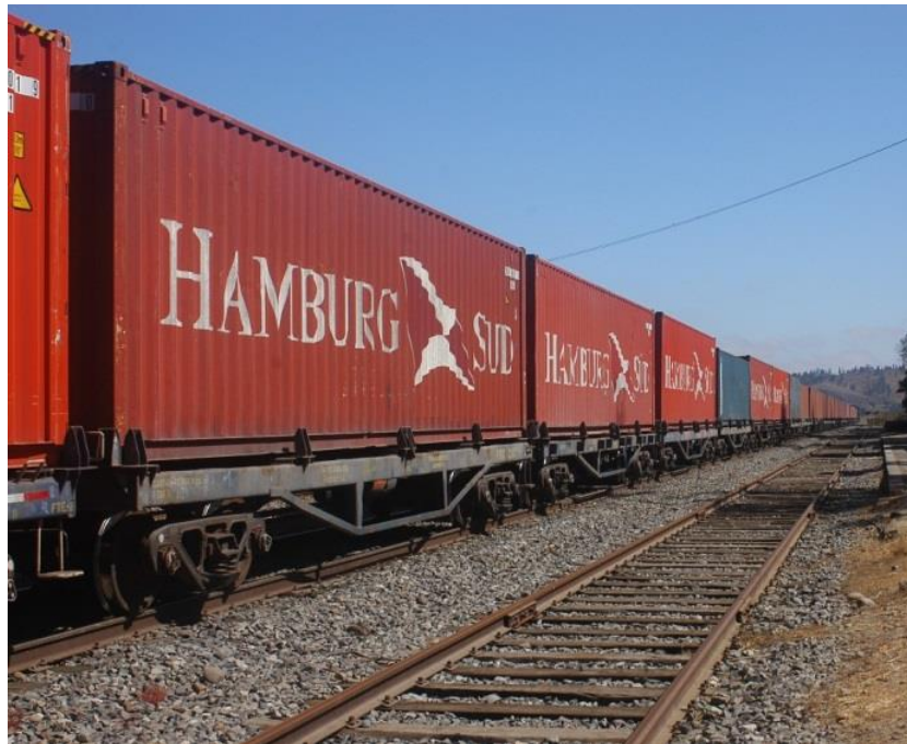
Containers camino al puerto de San Antonio (IF)

Por el norte y con ventajas comparativas relevantes por su cercanía con los países limítrofes, el complejo portuario compuesto por Antofagasta-Mejillones-Iquique , pareciera se merece (por estudiar) la característica de Puertos de Gran Escala. Arica está a 350 km. de Iquique y Copiapó a 950 km., ciudades que podría entrar en el radio de influencia y captura de exportaciones e importaciones para este complejo portuario (macro zona norte). Entonces, la conectividad regional y con Países vecinos requiere de una red de carreteras y ferrocarriles, ¿en cuánto tiempo más? ¿geopolíticamente estamos compitiendo?